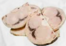
PESCE SPADA 1° EXTRA A TRANCE SASHIMI AL KG art.11085