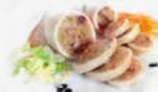
CALAMARI RIPIENI GRATINATI GR 400 art.03009