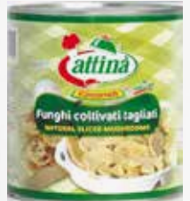
FUNGHI AL NATURALE KG 2,65 LATTA ATTINA art.H020