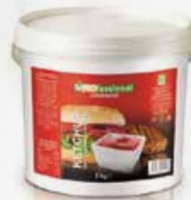
KETCHUP SECCHIELLO Kg 5 GF art.11978