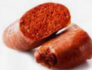
NDUJA PICCANTE SVT SING. AL KG art.S077