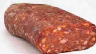
SPIANATA DOLCE SVT STAGIONATA AL KG art.10199