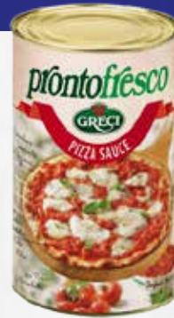
POLPA PIZZA SAUCE FINISSIMA FTO KG 5x3 art.A075