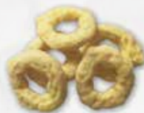
ANELLI ALLA ROMANA 12 X 500 GR art.13099