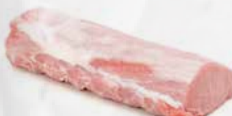
LONZA SUINO FRESCA AL KG art.B069