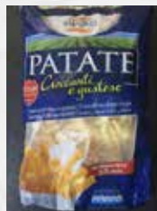
PATATE 10/10 PREFRITTE SWORD AL KG art.10981