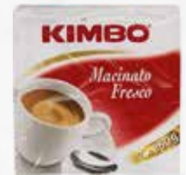
CAFFÈ KIMBO MACINATO FRESCO Gr 250x2 art.05823