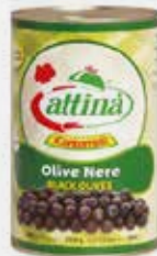
OLIVE NERE INTERE Kg 4,5 CA ATTINA art.H007