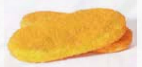
COTOLETTE DI MERLUZZO GR 100 C/PANATURA CROC. art.13128