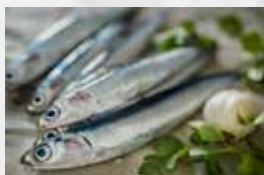
ALICI INTERE DELL'ADRIATICO BS GR 900 art.11181