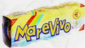
TONNO OLIO GIRASOLE GR 80x3 MAREVIVO art.I413