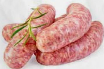
SALSICCIA FRESCA ROSSA DOLCE - SFUSA AL KG art. S182