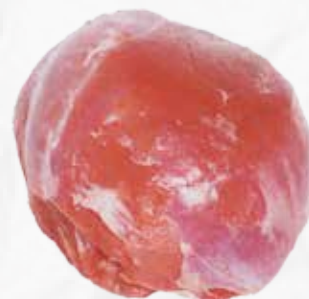
NOCE VITELLONE POL AL KG art.S184