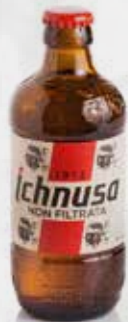
ICHNUSA NON FILTRATA CL 33 VAP - art.12271