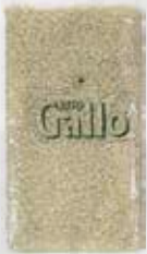
RISO ORIGINARIO GALLO KG 1 CELOPHANE art.P370