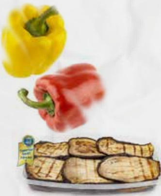
MELANZANE PEPERONI GRIGLIATI OLIO GIRASOLE GR 500 RENNA art.H076