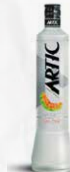
WODKA ARTIC LT 1 FRUTTATA art.03520