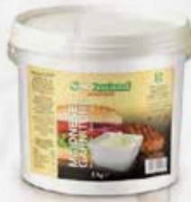
MAIONESE SECCHIELLO Kg 5 GF art.11977