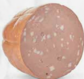
MORTADELLA PURO SUINO - AL KG art.S123