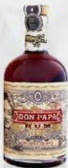
RUM DON PAPA 7 ANNI CL 70 art.13071