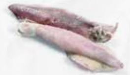
CALAMARI SPORCHI U/3 iqf cm25.32 AL KG art.I101