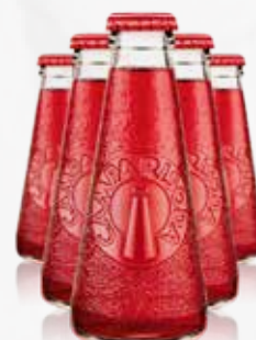
CAMPARI SODA CL 9.8 VAP X50 art.06646