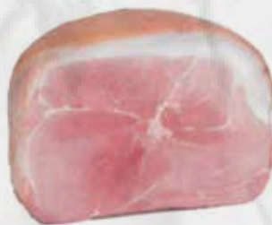
PROSCIUTTO COTTO EXTRA GOLD S/POLIF. AL KG art.S189