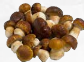
FUNGHI PORCINI INTERI 1° EXTRA GR 500 LUNAF art.11394